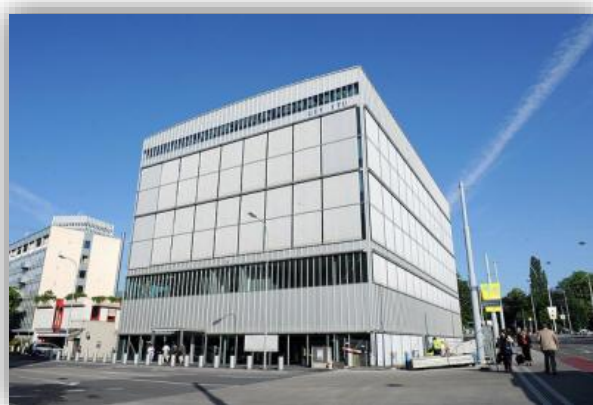
Вход в здание "Монбрийан", на заднем плане – площадь Наций

По прибытии участники собраний должны получить электронные пропуска в здании "Монбрийан". Электронные пропуска делегатов дают возможность входа в штаб-квартиру МСЭ только через здание "Монбрийан" на время проведения собрания; выходить делегаты могут через здания "Башня" или "Варембе".