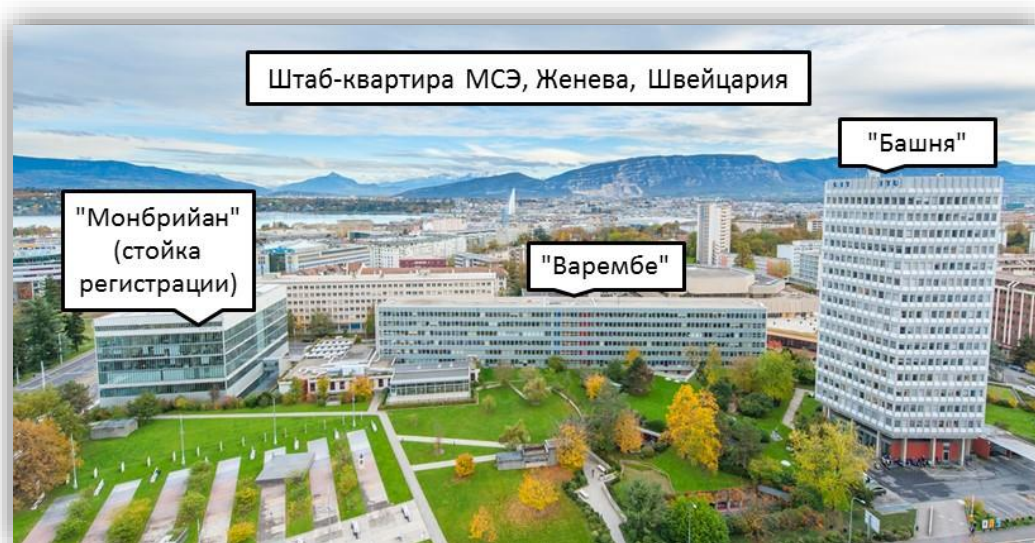
Штаб-квартира МСЭ, с видом на центр Женевы и фонтан (Jet d'Eau) на заднем плане